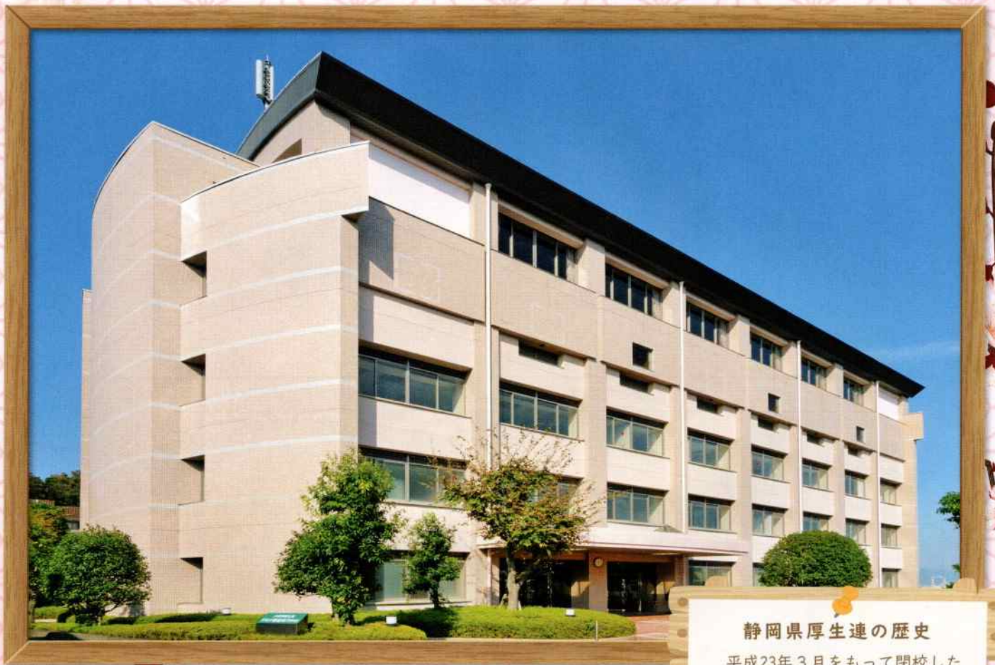
するが看護専門学校（富士市）