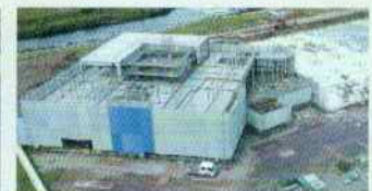
鉄骨建方施工完了(健管棟)