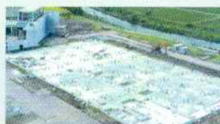
基礎コンクリ工事(病院棟)